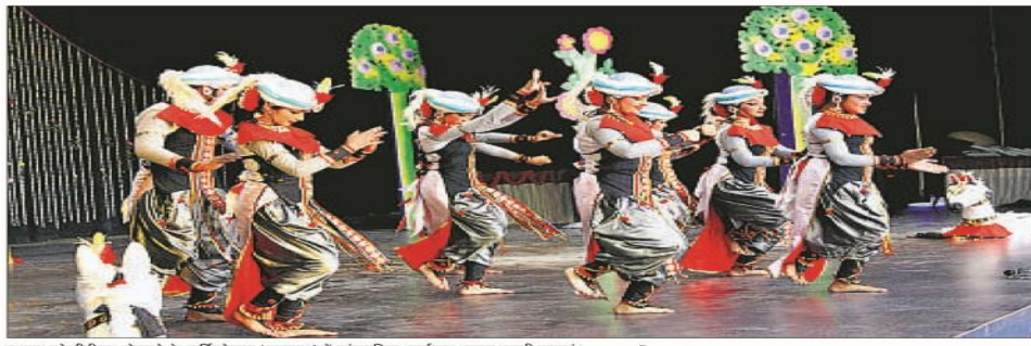
म प्रस्तुत करती छात्राएं।

4 दिनिक जागरण<u>धनबाद, 17 नवंबर 2016</u> बोकारो जागरण