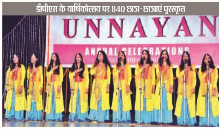
कार्यक्रम पेश करती छात्राएं।

इसके अलावा डीपीएस बोकारो द्वारा संचालित दीपांश शिक्षा केन्द्र के बच्चों स्वेटर प्रदान किया गया। गरीब महिलाओं के लिए डीपीएस बोकारो द्वारा संचालित निशुल्क व्यावसायिक प्रशिक्षण केन्द्र कोशिश की प्रशिक्षणार्थियों को प्रमाण-पत्र प्रदान किया गया। गणित प्रतिभाओं को प्रोत्साहित करने के उद्देश्य से डीपीएस बोकारो द्वारा आयोजित वार्षिक आर्यभट्ट गणित प्रतियोगिता के विजेताओं को भी नगद पुरस्कार, मेरिट सर्टिफिकेट व मोमेंटो दिए गए। इस अवसर पर अतिथियों ने डीपीएस बोकारो की वार्षिक पत्रिका पर्ल जुबली विशेषक डिप्स रिफ्लेक्शन का लोकार्पण भी किया।