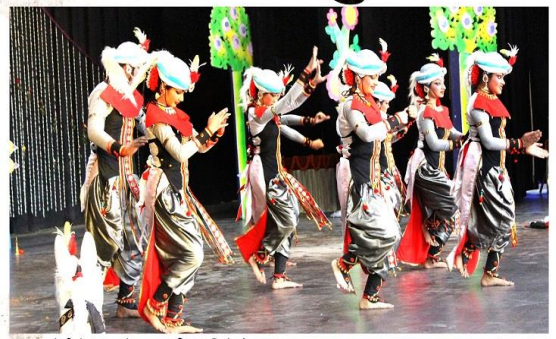
कथक शैली में 'दशाश्वमेध घाट' की प्रस्तुति ने मोहा मन