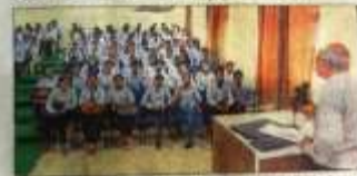
समर इंटरशिप में भाग लेने वाले छात्रों को उपयोगिता के प्रतिबोध कराया गया।