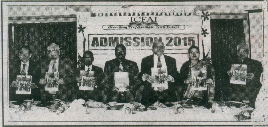
नये कोर्स को लांच करते विशिष्टजना