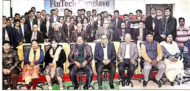
फाइनेंशियल टेक्नोलॉजी पर आयोजित सम्मेलन में शामिल विशेषज्ञ और विद्यार्थी.